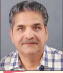
સી.એમ. દિવેદી પ્રમુખ